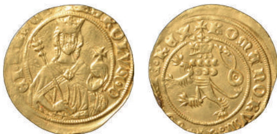
Královský dukát Karla IV. ►

Během husitských válek (1419–1434) nastal úpadek centrální politické i hospodářské moci, který se projevil také v rozkladu peněžního oběhu. Přestaly se razit groše a docházelo k ražbě stále menších peněz (haléřů) a k padělání mincí.