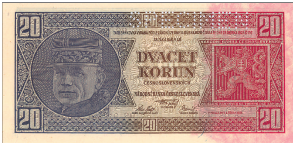
▲ Bankovka 20 Kč z roku 1927