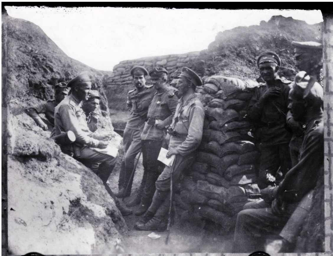
Porada velitelů praporů čs. brigády-severní úsek v zákopech 23. 6. 1917

Fotografie k tématu laskavě poskytla Československá obec legionářská.