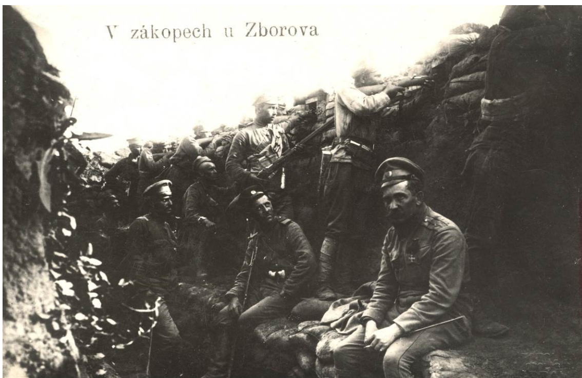
V zákopech u Zborova