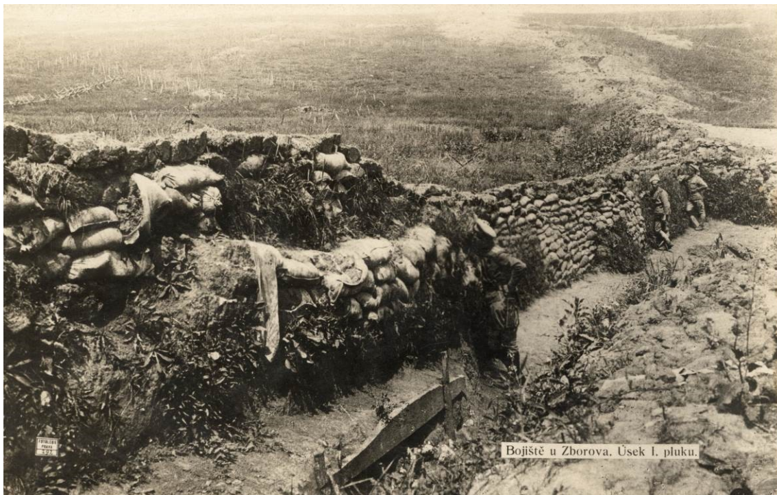
Bojiště u Zborova. Úsek I. pluku.