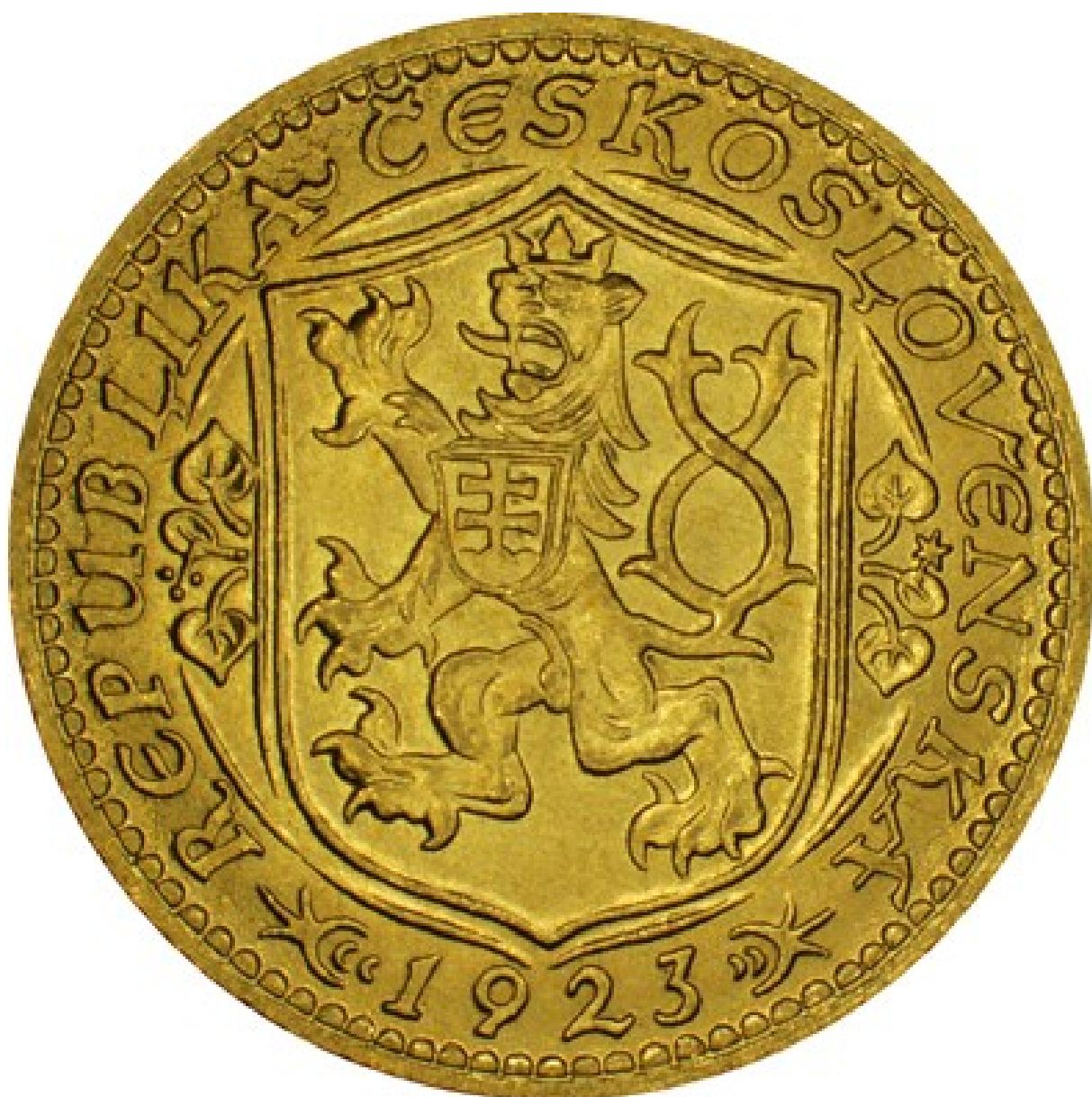
Rubová strana svatováclavského jednodukátu s ročníkem 1923.