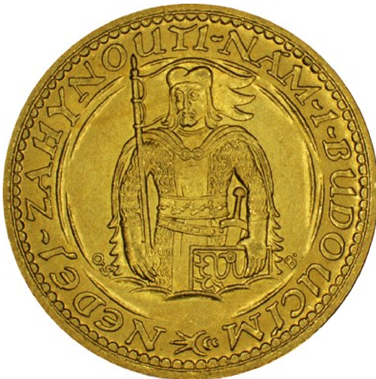
Lícní strana svatováclavského jednodukátu.