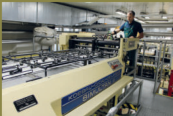
Tiskový stroj Simultan II při tisku ofsetových partií.

Třetí tisková operace, měditisk rubové strany, byla připravena na 3. listopad 2021 a postupně vzniklo šest variant barevnosti. S rozložením zelené barvy však nebyla spokojenost a proto bylo rozhodnuto upravit šablonové válce, přenášející barvu na tiskovou formu. Ve zkouškách pokračovali tiskaři následující den a po schválení osmé barevnosti byla ihned zahájena sériová výroba. Tisk celého nákladu byl dokončen 5. listopadu 2021 čtyřbarvovým tiskem z hloubky ve čtyřech barvách na stroji KOEBAU Intagliocolor 8.