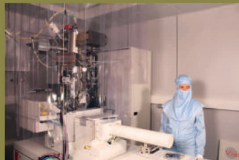
Výroba holografického masteru v Ústavu přístrojové techniky v Brně.