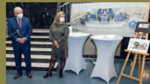
Návrh bankovky byl představen na slavnostní prezentaci 7. 10. 2020.