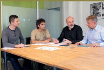
Diskuse nad podobou hologramů v Ústavu jaderného výzkumu v Řeži.

Portrét T. G. Masaryka nebyl převzat ze staršího díla, ale byl zkonstruován jako ideální portrét designéry hologramu.