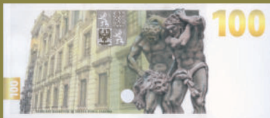
Rubová strana návrhu Evy Haškové, doporučeného k realizaci.