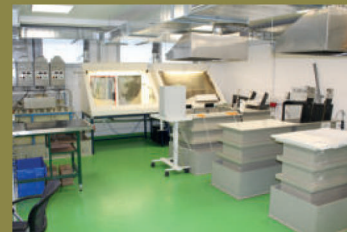
Rozmnožování hologramů galvanickou cestou ve společnosti IQS Group.