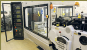
Aplikační stroj Heidelberg/Cavomit při aplikaci hologramů.

Text: Jaroslav Moravec • Grafická úprava: Jana Skořepová, grafické studio Jura • Tisk: Státní tiskárna cenin, státní podnik, Praha