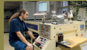
Tiskový stroj Numerota II při tisku sériování a číslování.