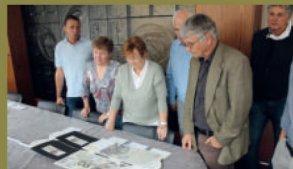
Jednání Komise pro posuzování návrhů na české peníze.