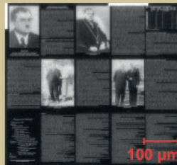
Část nanografiky a nanotextu na ploše 0,74 × 1,28 mm.