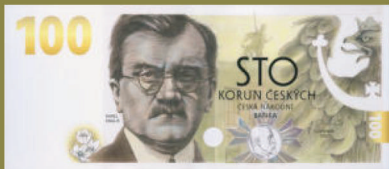
Lícní strana návrhu Evy Haškové, doporučeného k realizaci.

Bankovní rada České národní banky potvrdila návrh Komise a schválila realizaci návrhu akademické malířky Evy Haškové na svém jednání 1. října 2020. Výtvarný návrh pamětní bankovky představil guvernér České národní banky Jiří Rusnok na slavnostní prezentaci 7. října 2020 v Expozici České národní banky v budově jejího ústředí v Praze.