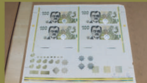
Čtyřobrazcový tiskový arch s kompletní lící stranou schválený do sériové výroby.