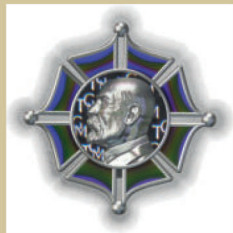
Hologram s motivem Řádu T. G. Masaryka III. třídy vzor 1990.

Hologram však nese i skrytý prvek neviditelný za běžných světelných podmínek, skrytý obraz čitelný laserem „Covert laser readable image“. Při použití laserového čtecího zařízení se na pozadí pod hlavními motivy zobrazí skrytý text v podobě monogramu TGM.