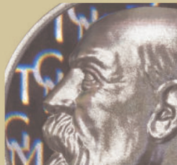
White 3D efekt na portrétu T. G. Masaryka a Full 3D efekt v jeho pozadí.