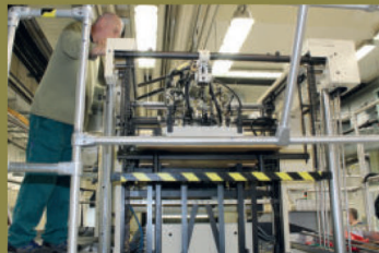
Tiskový stroj Intagliocolor 8 při tisku měditiskových partií.