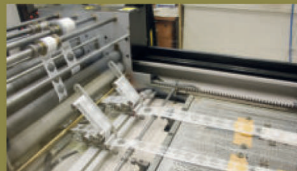
Pohled do aplikačního stroje s pásem hologramů v průběhu aplikace.