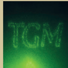
Skrytý obraz na pozadí hlavních motivů, čitelný pouze laserem.