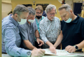
Posuzování výjezdů jednotlivých tiskových operací a schvalování nátisků do sériové výroby zástupci České národní banky, designéry, rytci a tiskaři Státní tiskárny cenin.