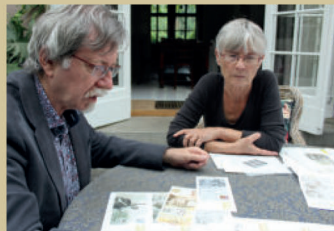
V průběhu tvorby návrhu se uskutečnila řada konzultací výtvarného a technického řešení.