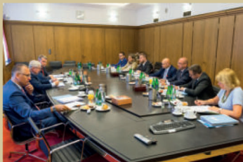
Jednání bankovní rady České národní banky, která rozhoduje o plánu emise i realizaci bankovek a mincí.