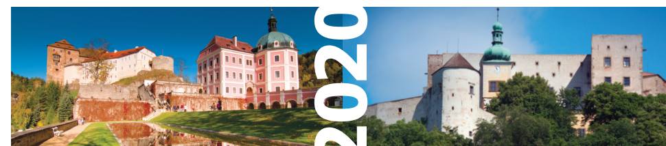
Bečov nad Teplou