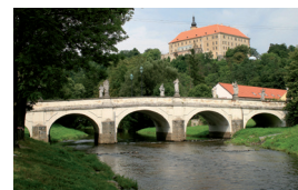
Barokní most v Náměšti nad Oslavou