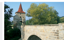
Renesanční most ve Stříbře