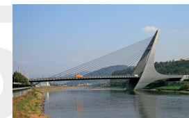
Mariánský most v Ústí nad Labem