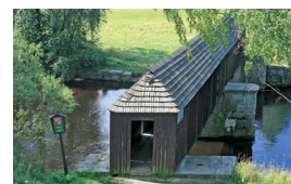
Dřevěný most v Lenoře