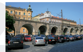
Negrelliho viadukt v Praze