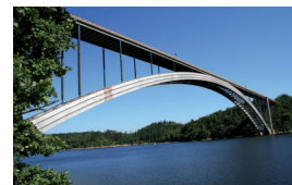
Žďákovský obloukový most