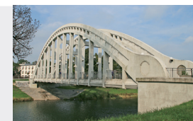
Železobetonový most v Karviné-Darkově