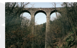
Železniční most v Žampachu