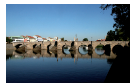
Gotický most v Písku

Všechny mince cyklu „Mosty České republiky“ jsou vyrobeny ze zlata o ryzosti 999.9. Jejich hmotnost činí ½ trojské unce, tj. 15,55 gramů, a jejich průměr je 28 mm. Mince se vydávají ve dvojím provedení ražby – v běžné kvalitě, u které je celá plocha mince stejně leštěna, a ve špičkové kvalitě s leštěným mincovním polem a matovaným reliéfem.