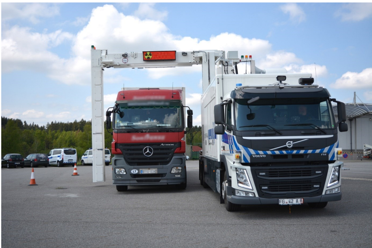
Mobilní velkokapacitní rentgen - neinvazivní kontrola zboží v nákladových prostorech kamionů