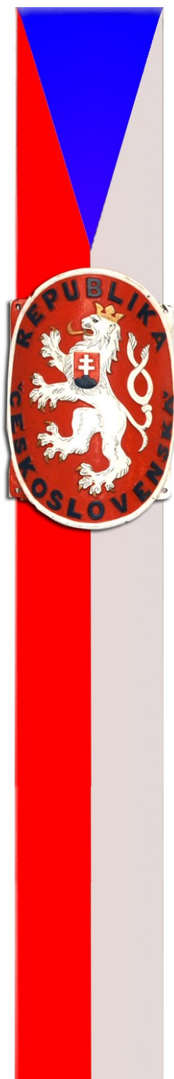
Hraniční sloup ze třicátých let dvacátého století