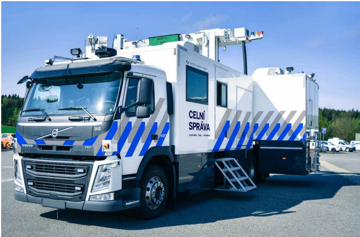
Mobilní velkokapacitní rentgen