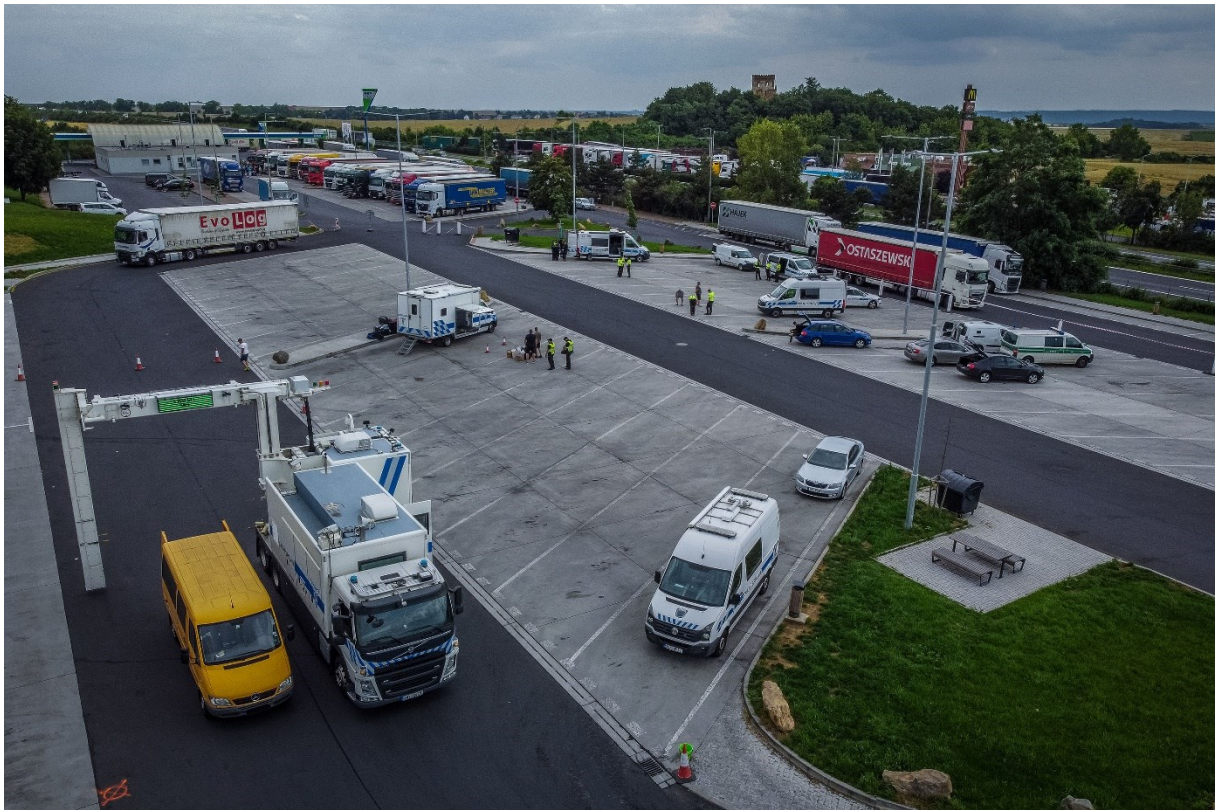
Mobilní velkokapacitní rentgen - neinvazivní kontrola zboží v nákladových prostorech dodávek