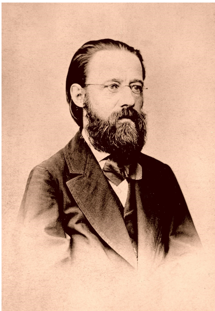
Portrét B. Smetana kolem r. 1870 (Národní muzeum – Muzeum Bedřicha Smetany, inv. č. S 217/1739)