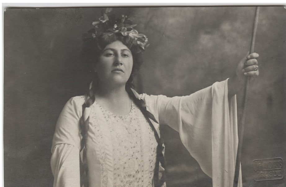
Ema Destinnová jako Libuše (Národní muzeum – Muzeum Bedřicha Smetany, inv. č. E XXI 259)