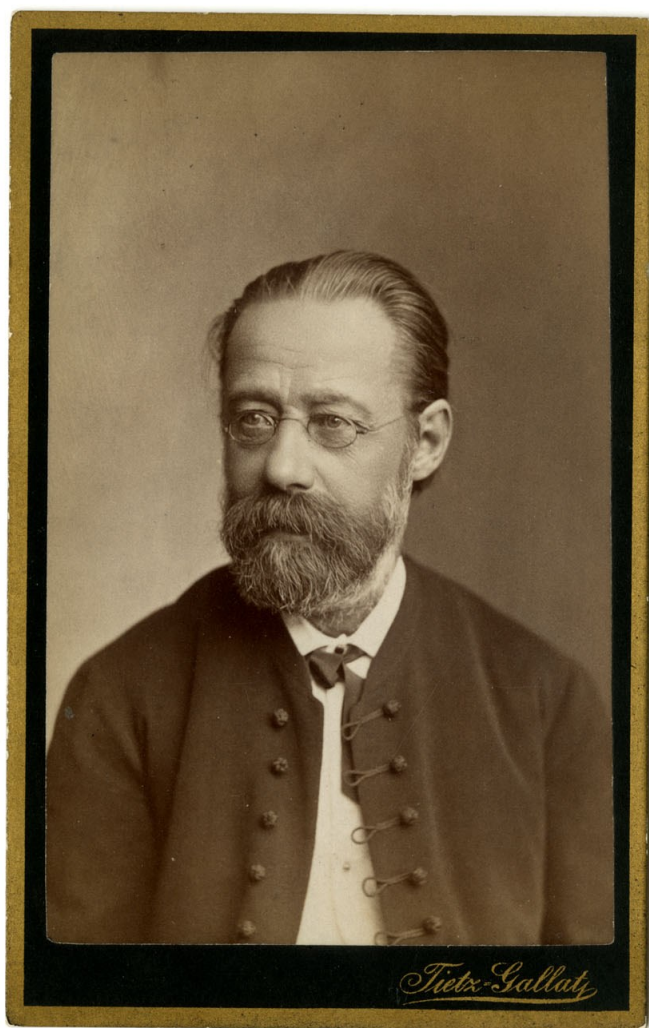
Portrét B. Smetana 1880 (Národní muzeum – Muzeum Bedřicha Smetany, inv. č. S 217/1749)