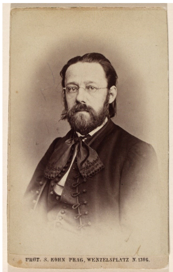
Portrét B. Smetana 1863 (Národní muzeum – Muzeum Bedřicha Smetany, inv. č. S 217/1736)